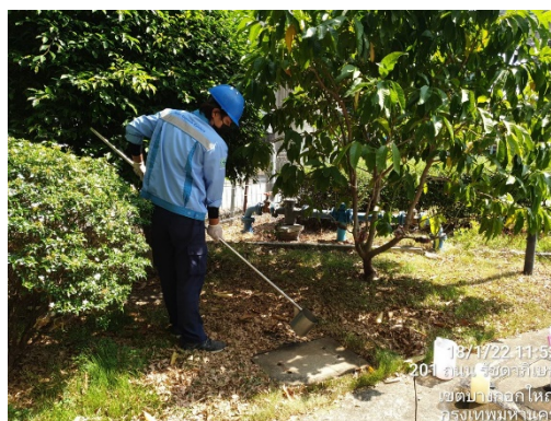
น้ำทิ้งที่ออกจากระบบบำบัดน้ำเสียของโครงการ (บ่อพักน้ำใส)